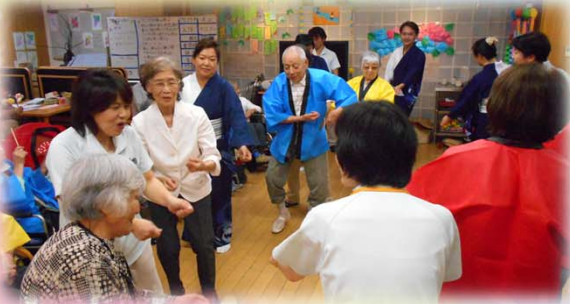
☆七夕会☆ ~星に願いを~