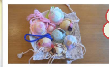
手工芸 ストラップ (アイス型)