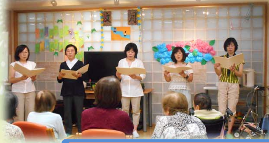
コーラス(美梨音の皆様)