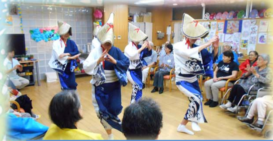
盆踊り(十条めぐ組の皆様)